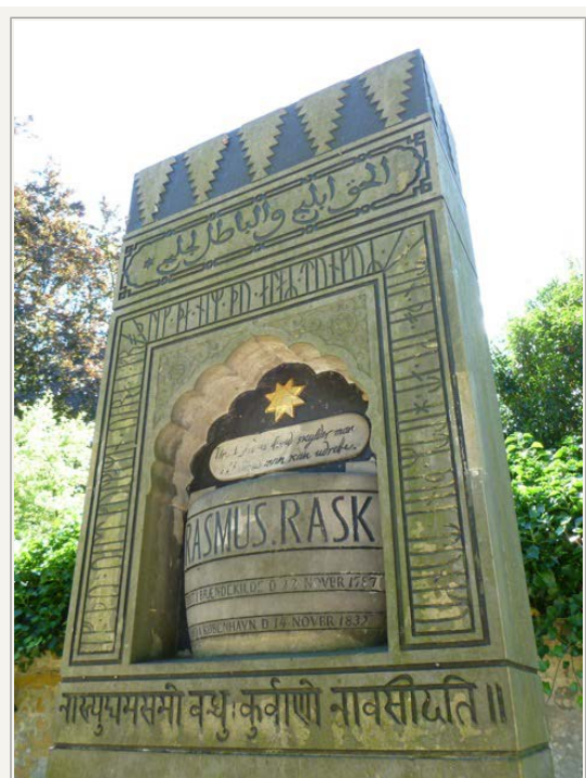
Rasmus Rasks gravsten på Assistens Kirkegård i København med indskrifter på fire forskellige sprog – hver med sin skrift.

Indoeuropæistikken udviklede sig siden i samklang med nationalromantikken indgående dialektbeskrivelser og indsamlinger af folkesagn og eventyr – ikke mindst i Tyskland gennem brødre Grim.