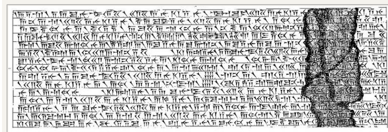
Tegnet udsnit af den tresprogede Behistun-indskrift (ca. 500 f.Kr.) på en klippevæg i Kermashah, Iran. De gamle persere brugte kileskriften på en helt anden måde end assyrere, babyloniere og sumerere.

Rask begav sig i 1816 ud på en syv år lang farefuld færd til Indien. Den førte til flere epokegørende opdagelser. Han fandt ud af, at det gamle iranske kultursprog avestisk, dengang kaldet zendisk, ikke var en dialekt af sanskrit, men faktisk tilhørte den iranske sproggrænse – de iranske og indiske sprog står hinanden nær, især på de tidlige sprogtrin. Undervejs sendte han hele tiden optegnelser hjem, så resultaterne ikke skulle gå tabt, hvis han selv omkom. Fra oldtidsbyen Persepolis skrev han "kileskriften er en stum taler, dog håber jeg, at det skal opdaget, når de indiske sprog og Zendisk blive mig mere bekendte; det er soleklart, at det er en virkelig skrift, ikke noget fantasispil". Hans indsats inden for studiet af det nærtbeslægtede sprog oldpersisk (forfader til vore dages persisk) var ikke mindre betydningsfuld: Det lykkedes ham at afslutte strabaserne med en tydning af den oldpersiske kileskrift, og vi kan derfor i dag læse lertavler og segl samt klippeindskrifter, hvor de achæmenidiske konger hylder sig selv og deres sejre.