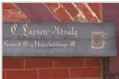
Særskrivning er ikke noget nyt fænomen. Her et skilt fra Den Gamle By i Århus.

alle germanske sprog, som har den samme tradition for kompositumdannelse, som fx svensk , norsk , tysk og hollandsk . På engelsk er særskrivning ligefrem normen i mange ordforbindelser, hvilket nok er årsagen til at mange beskylder engelsk for at være inspiration til særskrivning i de andre sprog. Men i