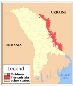
Transnistrien er lidt mindre end Fyn

statsdannelse, som i dag kalder sig Preddnjestrovskaja Moldovskaja Respublika og ikke anerkender Moldovas overhøjhed, er i vid udstrækning befolket af etniske russere, men også af både moldavere og ukrainere foruden andre mindre etniske grupper. Den langstrakte stat langs østbredden af Dnjestr, der er kilet ind mellem det øvrige Moldova og Ukraine, er lidt mindre end Fyn, men har over en halv million indbyggere.