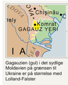
Gagauzien (gul) i det sydlige Moldavien på grænsen til Ukraine er på størrelse med Lolland-Falster

Hældningen mod Rumænien var med til at udløse selvstændighedsbestrebelse i to områder af republikken Moldova, Gagauz og Preddnjestrovskaja Oblast (Området ved Dnjestr). Hvor førstnævnte er blevet løst ved et fra alle sider anerkendt lokalt selvstyre, er sidstnævnte problem stadig åbent.