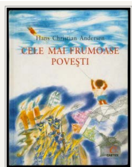
"Den Standhaftige Tinsoldat" på moldavisk

Konflikten omkring PMR, som den selvdråbte transnistriske republik forkortes, er stadig ikke løst. Republikkens præsident, Igor Smirnov, som oprindeligt stammer fra Petropavlovsk på Kamtjatka, blev valgt første gang i 1990 på en protestliste mod moldavisk uafhængighed af Sovjetunionen og er blevet genvalgt med stigende stemmetal i 1996, 2001 og 2006. Smirnov, som er født i 1941, har erklæret, at han vil gå af, når PMR er blevet internationalt anerkendt som uafhængig stat. Så vi kan forvente, at han genopstiller til præsidentvalget i 2011, og at valget lige så lidt som de forrige bliver anerkendt af det internationale samfund. Måske vil han i år overgå sin hidtidige rekord fra 2006 med over 82 % af stemmerne.