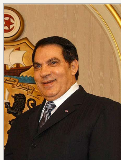
زين العابدين بن علي, Zine El Abidine Ben Ali, f. 1936. Tunesiens eneheriker i 23 år (og Ridder af Elefantordenen). I et sidste desperat forsøg på at beholde præsidentkontoen henvendte han sig for første gang nogensinde til befolkningen i en tv-tale på modersmålet, tunesisk, i stedet for det sædvanlige elite-arabisk.

De ret markante forskelle mellem det arabiske skriftsprog og de uformelle arabiske talesprogsvarianter kategoriseres ofte som et klassisk eksempel på diglossi . Sådanne forskelle findes ganske vist på alle sprog – mange danske dialekter afviger jo også i høj grad fra rigsdansk. Den primære forskel på den danske og den arabiske