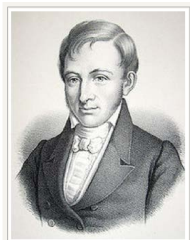
Rasmus Rask (1787-1832)

I 1734, 18 år efter Leibniz' død, blev et forslag til forenklet latin offentliggjort i et tillæg til Acta Eruditorum , et akademisk tidsskrift der udkom i Leibniz' fødeby Leipzig. Her kunne man læse om "en ny plan til opfindelse af en