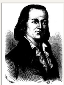
Storebror Chappe (1763-1805)

Jeg har her tilladt mig at interpolere lidt, så citaterne såvidt muligt fremtræder i sprogets allersønneste form. Originalerne selv er vanskelige at tyde fordi de er fulde af rettelser; en enkelt af disse er særlig interessant. Det meget internationale ord "succede" i teksten ovenfor er rettet fra det mere snævert italiensk-franske "reusir" – og så kunne man jo spekulere på om Rask var inspireret af en fransk eller italiensk tekst da han skrev det? Og faktisk, den første meddelelse som brødrene Chappe sendte med deres prototype på en optisk telegraf den 2. marts 1791 kl. 11.00 mellem Brulon og Parce lød netop: Si vous réussissez, vous serez bientôt couverts de gloire – "Hvis det her lykkes, bliver I snart overdækket med hæder".