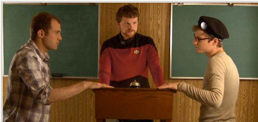
CONLANG - The Movie, "en unik komedie om hemmelig forelskelse, ekstrem lingvistik og kærlighedens sprog".

Skulle man ellers være hyllet i den opfattelse at esperantister mangler selvironi, kan man få afkræftet sine fordomme ved at se på støtlisten til " CONLANG the Movie ". Denne 15-minutters komedie af Marta Masferrer og Baldvin Kári