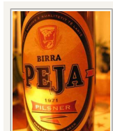
... Birra Peja, albansk øl fra Peja

Et folks nationale liv udfolder sig som bekendt ikke kun i dets kirker. Derfor er det måske også sigende, at Pećko pivo – dvs. øl fra bryggeriet i Peć, som i Jugoslaviens tid var populært over hele landet – ikke mere findes. I dag hedder øllen Peja – efter byens albanske navn – og fås normalt ikke uden for Kosovo. Dét er ikke kun betegnende for, at den serbiske og slaviske indflydelse i Kosovo med ét er forsvundet – men også for, at både menneske og erhvervsliv i Kosovo i dag er mere isolerede. Begge dele er resultat af krigen i 90'erne: