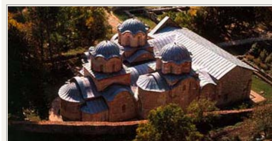
Patriarkatet i Peć er på UNESCOs liste over menneskehedens kulturarv

I 1912 genindtog den serbiske hær Kosovo, men efter 500 års besættelse var serberne i store dele af Kosovo ikke mere i flertal. Det gjaldt især i området