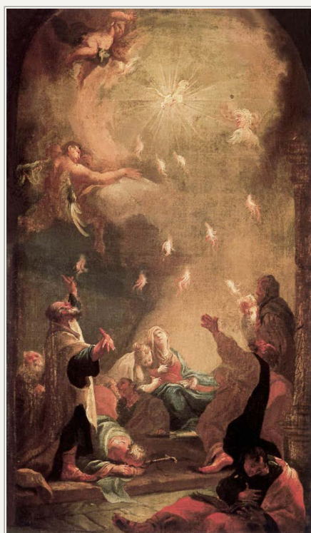
"Pinse" af István Dorffmaister, 1782. Ungarns nationalgalleri,