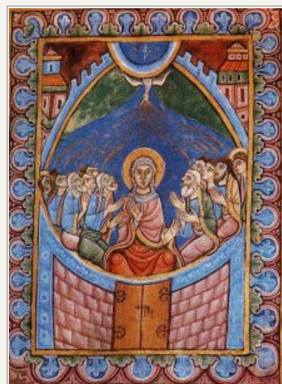
Der står ikke noget i Apostlenes Gerninger om at Guds Moder skulle have været med ved pinsemiraklet. Men det er hun alligevel tit i de gamle afbildninger. Ildtungerne skal forestille Helligånden. Duen symboliserer Guds Nåde, og tungetale er en nådegave. St Albans Psalter, England, ca 1130.

Det gode ved at være bogstavtro er at man selv