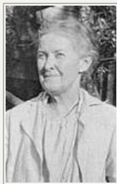
Agnes Ozman LaBerge (1870-1931), den første moderne tungetaler.

Den første rapporterede tungetale i moderne tid fandt sted i Topeka, Kansas, nytårsdag 1901, den første dag i det nye århundrede, hvor Agnes Ozman LaBerge i tre dage kun kunne tale og skrive kinesisk, mens hun var besat af Helligånden.