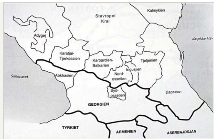
De kaukasiske republikkers formelle opdeling. I januar i år skabtes en ny administrativ enhed, det Kaukasiske Forbunds Distrikt, bestående af seks af de nordkaukasiske republikker som bliver lagt under Stavropolprovinserne. Den vestligste, Adygea, bliver lagt under Krasnodarprovinserne.