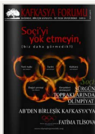
Forside af det tyrkiske magasin Kafkasya Forumus 2007-nummer om OL i Sothi. Der udgives en del af den slags tidsskrifter i den tjerkessiske diaspora.