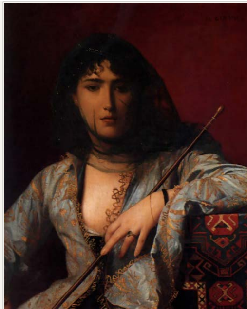
Tjerkessisk skønhed, malet af den franske orientalist Jean-Léon Gérôme i 1860'erne. Bemærk sløret. Tjerkessiske kvinder blev i århundreder anset for at være blandt de smukkeste og mest attraktive i de tyrkiske haremmer pga. deres hvide hud og blå øjne. Mange europæere var fascineret af Orientens haremmer, hvilket fremgår af en del af datidens malerier, romaner og digte. Unge tjerkessiske kvinder kunne findes på datidens slavemarkeder, hvilket bl.a. H. C. Andersen har bevidnet. Det var især fattige tjerkessere som solgte deres børn som slaver, hvilket ikke kun blev anset for særgeligt, men også som en social opstigning. Adskillige af de osmanniske sultaner har gennem tiden haft tjerkessiske mødre, hvilket anses for at have styrket relationen mellem Osmaneriget og Tjerkessien. Efter slaveriets afvikling og den russiske kolonisering af Kaukasus kunne man i slutningen af 1800-tallet og begyndelsen af 1900-tallet finde tjerkessiske kvinder fremvist på udstillinger i Nordamerika og Europa, og også i Danmark. Tivoli udstillede tjerkessere i år 1900.