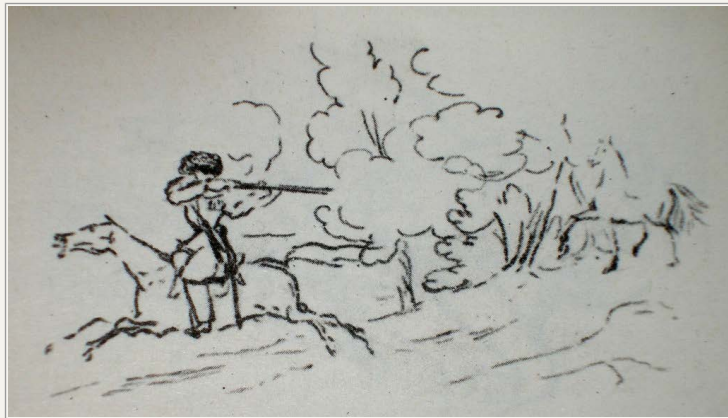
Den russiske forfatter Lermontov var ligesom Pusjkin og Tolstoj tæt knyttet til Kaukasus. Her er en tegning han lavede i 1830'erne. Lermontov og Pusjkin var i perioder forvist til Kaukasus. Lermontov mistede endda livet i en duel i Kaukasus, hvor hans hus i Pjatigorsk i dag fungerer som museum. Området havde tidligere været tjerkessisk, men var blevet erobret af Rusland i begyndelsen af 1800-tallet efter mange års krig, som havde presset tjerkesserne længere op mod bjergene i syd. Pjatigorsk blev i 1800-tallet den russiske overklassens kursted – på linje med Baden-Baden i samtidens Mellemeuropa.