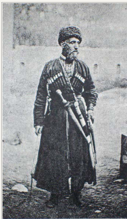
En Tsjerkesser (Adighè).

Der findes i Tyrkiet mere end to hundrede tjerkessiske landsbyer, hvoraf hovedparten er lokaliseret på den anatolske højslette. Usikkerheden om tallene skyldes også at betegnelsen tjerkesser ofte er blevet brugt om alle migranter fra Kaukasus.