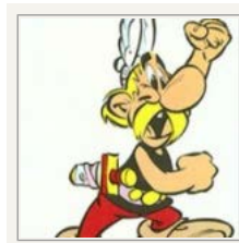
Det keltiske navnelement -rix er almindeligt kendt fra historierne om Asterix og hans gæve gallerer. Rix betød 'rig, mægtig'