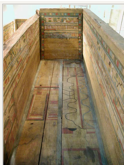
Bemalet trækiste fra el-Bershe i Mellemægypten, 12. dynasti (1985-1773 fvt.). De såkaldte Sarkofagtekster var en videreudvikling af Pyramideteksterne fra Gamle Rige og blev, undertiden som her ledsaget af vignetter og "landkort", skrevet på indersiden af stormændenes ligkister.

Tekstens "levende" karakter understreges endvidere af et andet fænomen i skriften. Som bekendt består mange af de ægyptiske hieroglyffer af afbildninger af dyr, mennesker og genstande. I daglig brug har man næppe tænkt videre over, at de tegn, man læste, faktisk var billeder, og ligesom andre logografiske skriftsystemer som kinesisk og den mesopotamiske kileskrift, udviklede ægypterne også stærkt stiliserede udgaver af tegnene, hvor det ikoniske indhold næppe længere kunne skelnes, i sammenhænge, hvor netop det ikoniske aspekt ved skriften var mindre væsentligt. Når teksterne skulle virke rituelt i sig selv, er det på sin vis naturligt, at sådanne aspekter træder tilbage i forgrunden, og netop i de pyramider, der startede traditionen med "dødelitteratur", kan vi observere, at man har været optaget af den tanke, at skriftens ikoniske karakter kunne forårsage utilsigtede virkninger.