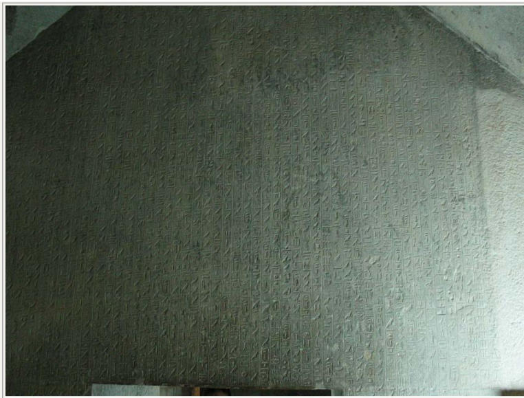
Indskrift fra kong Teti I's (2345-2181 fvt.) gravkammer i hans pyramide i Saqqara lidt syd for det moderne Cairo. Som det fremgår, er teksterne smukt og omhyggeligt udførte, men ikke specielt læsevenlige!

De gamle ægyptere byder på et af de mere ekstreme tilfælde af performativ sprogbrug.