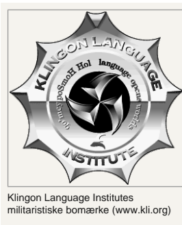
Klingon Language Institutes militaristiske bomærke ( www.klii.org )

Fans mødes rundt omkring i verden til Star Trek ' conventions ' hvor de klæder sig ud som figurer fra filmene. Der er butikker der sælger Star Trek-tøj og -tilbehør, og hvis man ikke vil bruge penge på en klingonpande, kan man lave en selv . Googles brugerflade findes på klingon. Og der er bands der synger på klingon. Se fx tyske " Klenginem " her med klingon-undertekster så man kan synge med.