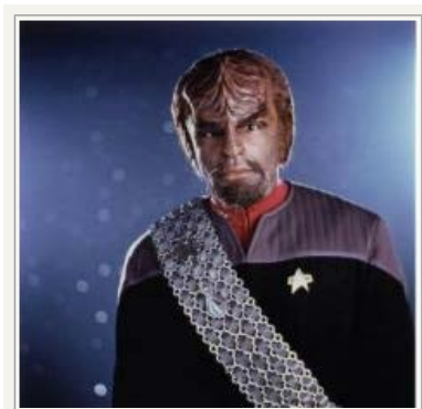
Lt. Worf, en tam klingon fra Star Trek. Her ved årsskiftet indledte DR HD en kavalkade med 10 af de 11 Star Trek-spillefilm. De bliver vist lørdage kl 20.50. Foreløbig er to af filmene sendt, nr 7 og 8, og hele serien slutter 6. marts med film nr 6 i serien.

Vi befinder os i science fiction-universet Star Trek , den største medieproduktion nogensinde. Siden 1967 er der lavet seks tv-serier på i alt 726 afsnit, 11 spillefilm (nummer 12 ventes om to år), talrige computer- og videospil, mængder af tegneserier, flere hundrede romaner og noveller og et oplevelsescenter i Las Vegas. Det er lukket for tiden, men bebudes genåbnet senere i år.