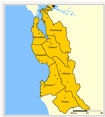
Mutsun er den sydøstligste af ohlone-stammerne i området lige syd for San Francisco (Kort: Wikimedia)

Og her kan man se 10 minutter af det hollandske operakompagni KlingonTerranResearchEnsembles opførelse af Floris Schönfelds klingon-opera "U" om det perfekte skrig: