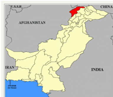
Chitral i Nordpakistan (Kort: Wikimedia)