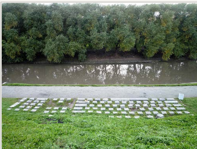
Neden for en grøn skråning ved Iserflodens bred midt i byen Jekaterinburg i Ural, Rusland ...

Af Ole Stig Andersen 14. oktober 2009 • I kategorien Kunst