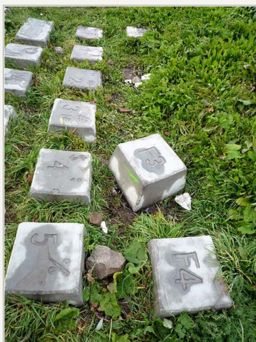
Men i 2008 blev monumentet hærget, og nu mangler både F1 og F2 ...

Biblen bogstaver børn Danmark Dansk Dialekter engelsk esperanto Formidling fransk identitet konsonanter Medier modersmål Musik Navne norsk Ord ordbøger ordforråd oversættelse Plansprog religion romanske sprog russisk Sjøv skriftsprog sprogdød Sproggeografi sproglort Sprogpolitik sprogteknologi svensk truede sprog tv tyrkisk tysk Udtale Underholdning video vokaler