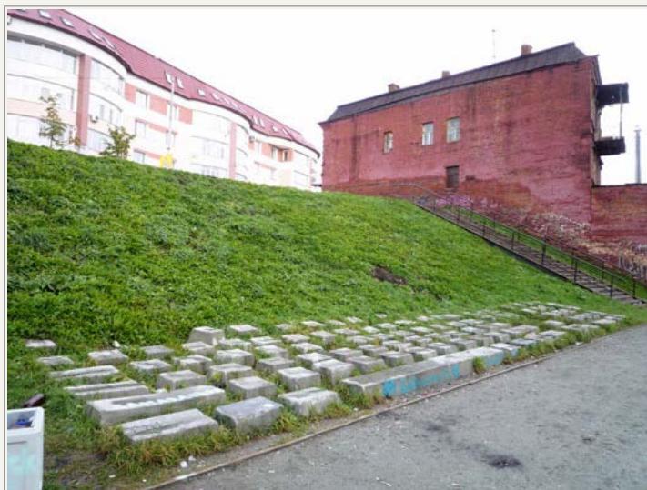
... har der siden 2005 ligget et særpræget monument for computertastaturet.