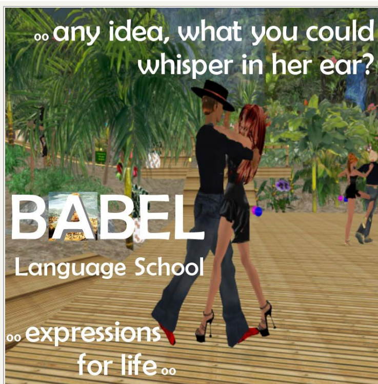
En af skolens reklamer beregnet til dansesteder

Fra efteråret 2006 til efteråret 2009 er antallet af samtidige brugere i Second Life steget fra 20.000 til ca. 80.000 på de mest travle tidspunkter. Gennem et avanceret internt søgesystem rækker man som aktør ud til en stor gruppe mennesker. Brugere fra næsten hele verden lader deres avatarer undersøge det virtuelle univers og reagere på annoncer, de såkaldte "Classifieds", der ser ud til at byde på noget, de er interesseret i.