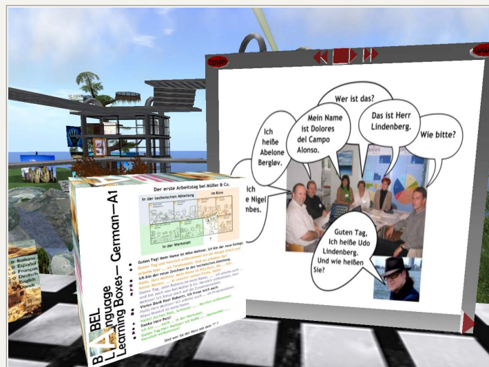
Medietavle med indljet stof til et kapitel p 4-6 lektioner – verst styrer man lyttekster, nederst navigerer man gennem siderne. Derudover udgiver tavlen et opgavekort og et link til en online ordbog

For at sttte op om kursisternes lringsforlb, har skolen valgt at gennemfre undervisning i udstyrede klasselokaler. Det aktuelle stof er slet op p tavler, som kan rumme et helt forlbs sider og dertil knyttede lyttematerialer. Ikke alle indbyggere har et sted, hvor de kan placere undervisningsmaterialet og ve sig eller efterbearbejde timens nyheder. Disse avatare vender gerne tilbage til klasselokalerne mellem undervisningsgangene, for at udbyde det lrte.