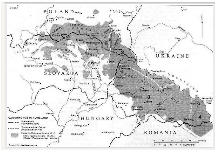
Lemkisk oprindelige udbredelse.